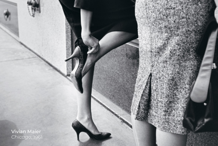
Vivian Maier Chicago, 1961